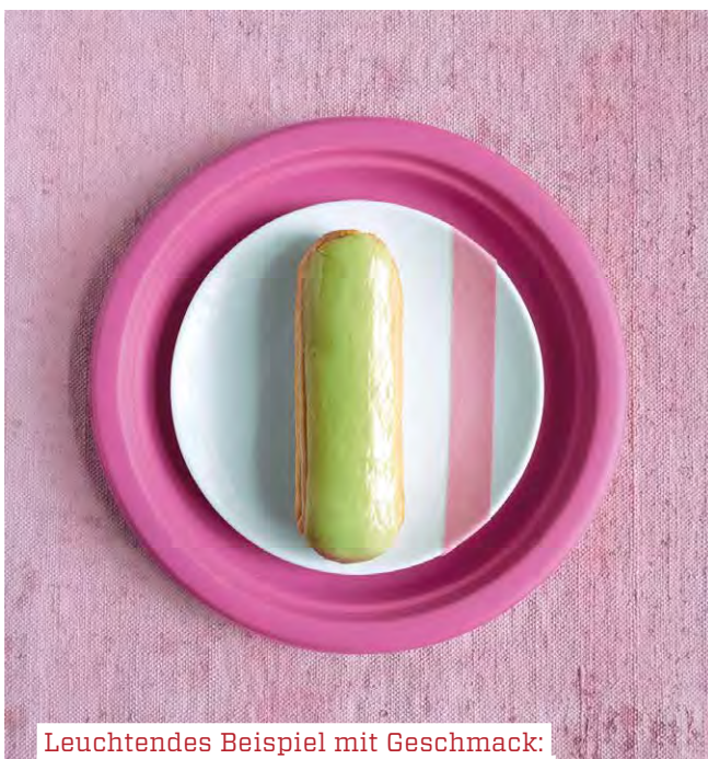
Leuchtendes Beispiel mit Geschmack: Die Pistazienglasur rundet das aromatische Eclair ab.