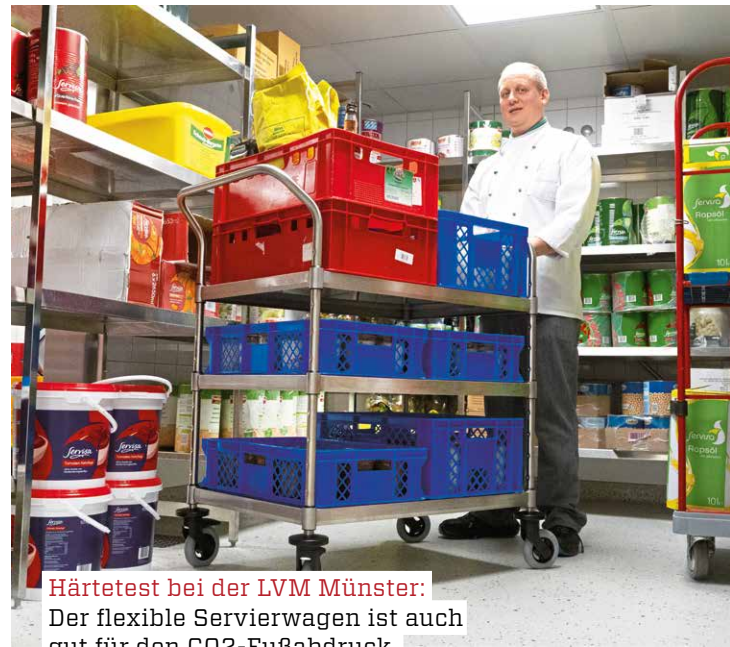
Härtetest bei der LVM Münster: Der flexible Servierwagen ist auch gut für den CO 2 -Fußabdruck.

sechs Eurobehälter auf einmal transportieren oder wahlweise bis zu 16 Getränkekästen – mit dem flexiblen Anpassen an verschiedene Transportmaße und Bordlasten bis zu 100 kg und einer Gesamt-Traglast bis zu 270 kg. Zudem erleichtert Variocart das Arbeiten erheblich: Adaptierbare Bordhöhen bis zu 900 mm und ergonomische Schiebegriffe würden eine gesunde Körperhaltung fördern. Variocart sei zu gängigen Logistiksystemen kompatibel, etwa Paletten- und Rollbehälterlogistik, und würde zudem durch den Bausatz-Versand die Transport-Emissionen um bis zu 75 % reduzieren.