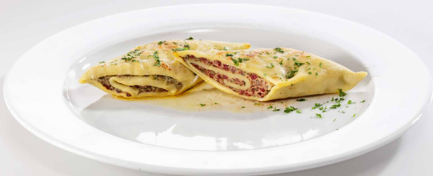
Reines Rindfleisch als Füllung - nach den Regeln der Kochkunst handgemacht.