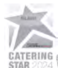
Catering Star in Silber für Rasant Planet

Für weitere Infos rufen Sie uns an oder fragen Ihren Fachberater!