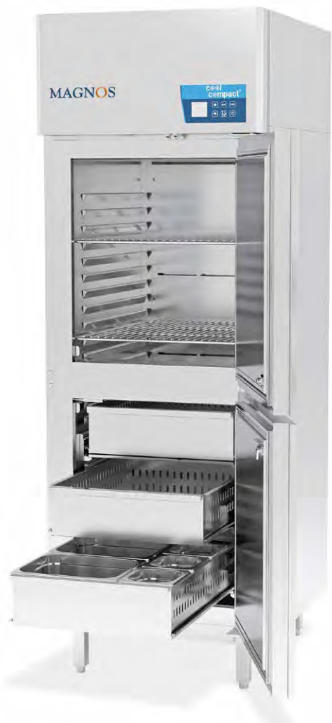
Der (Tief-)Kühlschrank ist mit Glastür, Tragrosten sowie Schubladen erhältlich.