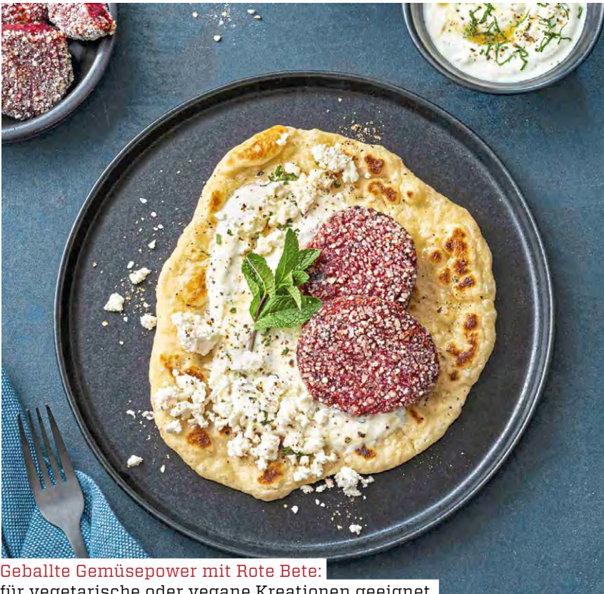
Geballte Gemüsepower mit Rote Bete: für vegetarische oder vegane Kreationen geeignet.