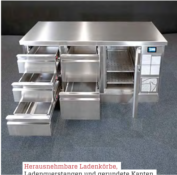
Herausnehmbare Ladenkörbe, Ladenquerstangen und gerundete Kanten.