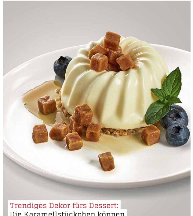
Trendiges Dekor fürs Dessert: Die Karamellstückchen können platzsparend aufbewahrt werden.